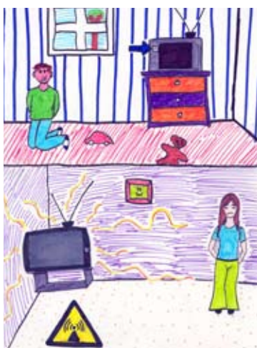
SÄKER STRÅLMILJÖ AV LINA SKÖLD, KORSÄNGSSKOLAN