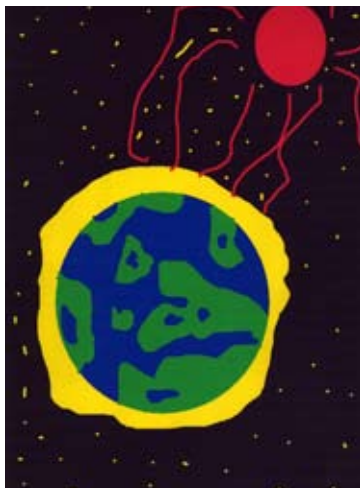
SKYDDANDE OZONSKIKT AV MARIA WALLÉN, FJÄRDHUNDRASKOLAN

2008 utlyste Enköpings kommun teckningstävlingen "Enköping målar miljön". Tävligen vände sig till alla skolbarn i grundskolan och uppdraget var att illustrera kommunens lokala miljömål. Nedan visas övriga vinnade bidrag i teckningstävlingen. Ett stort tack riktas till alla barn och ungdomar för fantastiskt fina bidrag.