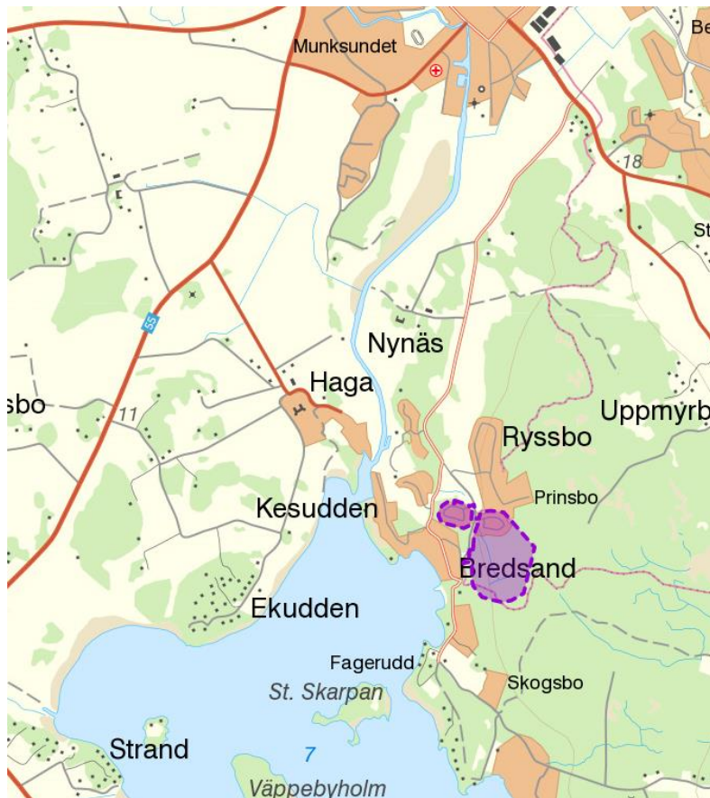
Orienteringsbild. Lila markering visar Planområdet..